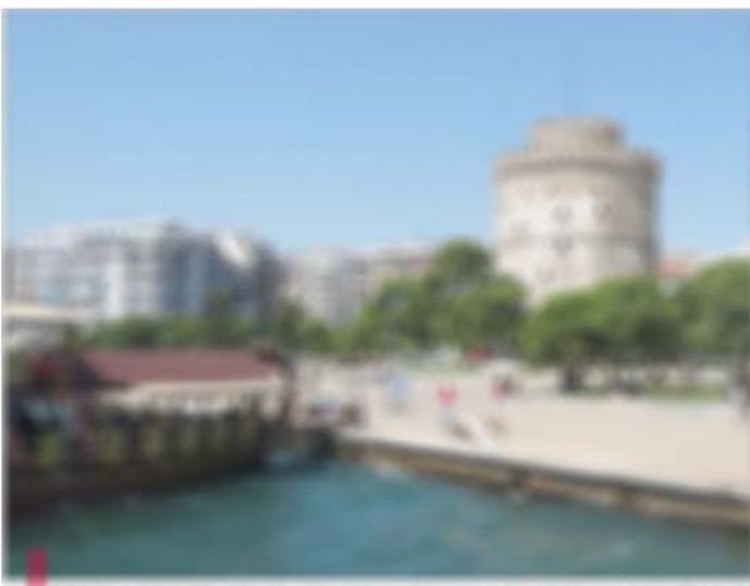
La tour blanche de Thessalonique, un des symboles de la ville. Ici, le centre historique de la ville, avec la tour blanche et le forum romain.

Une pause est obligatoire à la Basilique Saint-Georges, une des toutes dernières églises toujours partie d'un édifice. Les Ottomans, qui ont occupé la ville au XV e siècle, ont en effet converti les églises en mosquées, en déplaçant des minarets et en cachant les fresques et mosaïques (certains per-