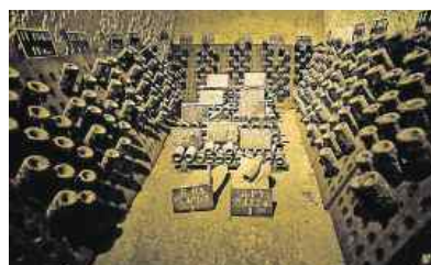
Un détour par les caves s'impose.