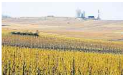
Des vignes à perte de vue.