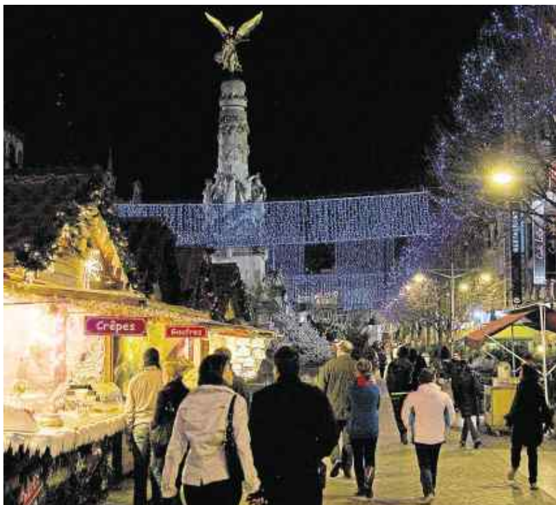
Du haut de la cathédrale, l'ange veille sur les badauds.

Sur le mail de la place Drouet d'Erilon s'alignent les chalets du village de Noël, le deuxième de France par sa taille. On y longe brasseries et restaurants, Reims est réputée pour ses adresses gourmandes. Et l'on s'arrête pour regarder magiciens, jongleurs et musiciens, ou acheter foie gras et pains d'épices et le biscuit rose qui accompagne la coupe et les bulles.