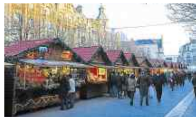
La ville s'illumine avec le marché de Noël.

Textes : Anne ROZE.